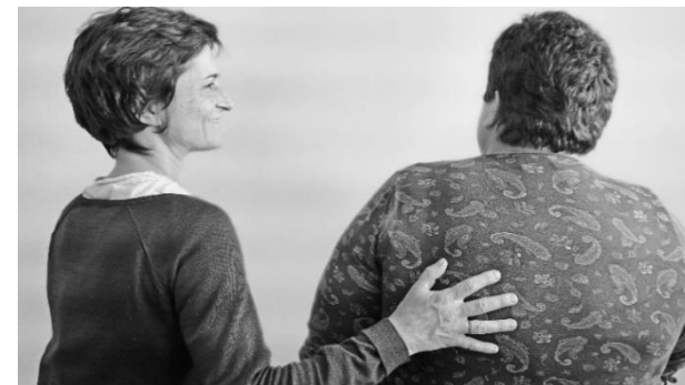
Photo réalisée par Christelle dans le cadre du projet Quel Talent ! Atelier animé par Camille TEQUI

ENSEMBLE, VALORISONS LES METIERS DU SERVICE A LA PERSONNE !