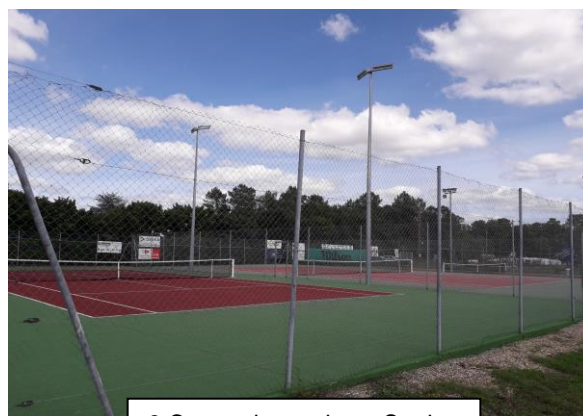
3 Courts de tennis au Stade

Nous vous souhaitons à toutes et à tous une excellente nouvelle saison sportive Bien cordialement TCP